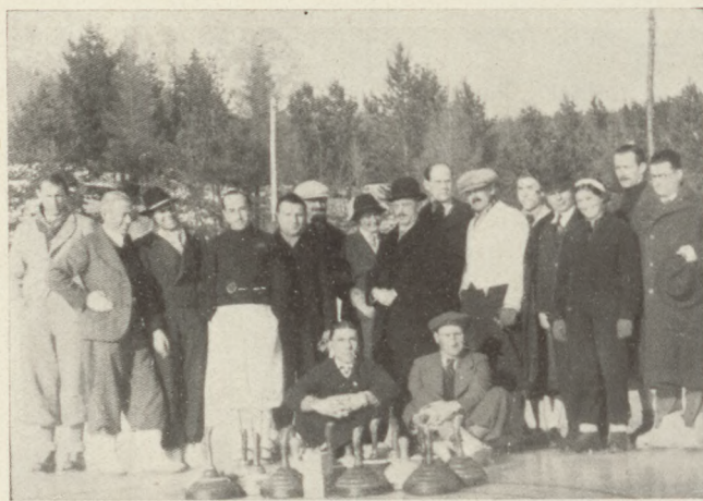
Az első fátrai jégteke versenyzői az ótátrafüredi jégpályán.