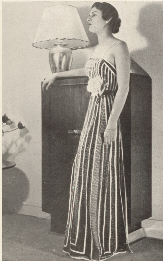
Jean Patou-modell: Fekete csipkeruha, fehér csipkerátéttel.

Az ékszerész lehámozta magáról a kabátot és lefrics-