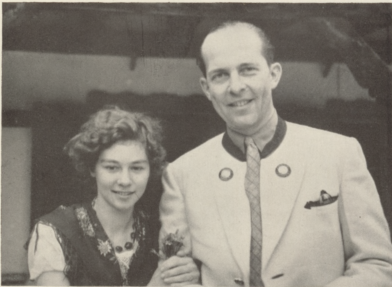
Pál görög trónörökös és menyasszonya Friderike angol kir. hercegnő