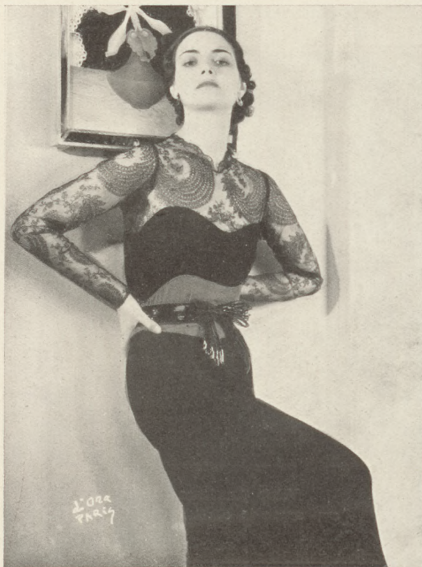
Ruha fekete gyapjú-anyag, csipke kombinációval, derékban piros bársony: Raphael kollekciójából

Akkoriban nagyon sok furcsa dolog történt nálunk. Emlékezni se lehet mindenre. Zsúfolt, változatos hónapok voltak, tele eseményekkel, lelki izgalmakkal. Erre az időre esik Fil-lér-nevű kutyánk pusztulása, akinek — én már csak így mondom — lázas, megindító tekintete ma is előttem van még, ebben az időben loptak ki négy hízott ludat az ólunkból és