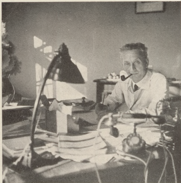
Szent-Györgyi Albert egyetemi tanár

Egymást érik a színházi jubileumok. Az elmúlt héten a Nemzeti Színházi centennáris díszelőadás után a Magyar Színház is megünnepelte fennállásának negyvenedik fordulóját. Ezalatt a negyven esztendő alatt igen sok kézen ment át az Izabella-téri színházépület, úgy, hogy tulajdonképpen az épület jubilált ezen a díszelőadáson — és nem a mai igazgatóság, amelyik alig néhány év óta vezeti a színházat.