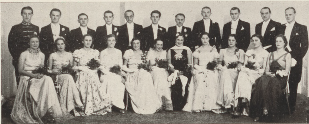
Szent István-bálon a csárdásnyitó párok:

nagy koncerteken. Nagyon érdekes, hogy kikből is tevődik össze egy ilyen érdekes zenei eseménynek a nézőtere. A szék-sorok elenyésző csekély töredékében ismerjük csak fel az úgynevezett pesti társaság hölgyeit és urait, a többiek — szintén nem ismeretlenek — a pénzvilág s a közgazdasági élei korifeusai. Mi ennek az oka? Nem, távolról sem az, mintha a keresztény középosztály érzéketlen volna a magasabb zenei kultúra iránt. Hiszen az Operában a törzsközön-ség éppen ebből a keresztény középosztályból kerül ki. A hangversenyek azonban módfelett, sőt szemérmetlenül drá-