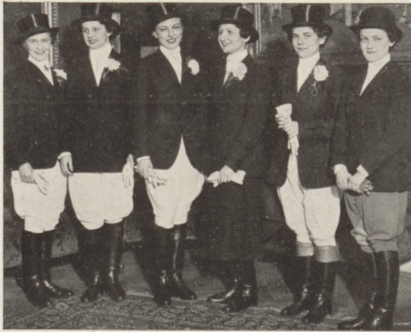
A Nemzeti Lovarda lovasünnepélyén.