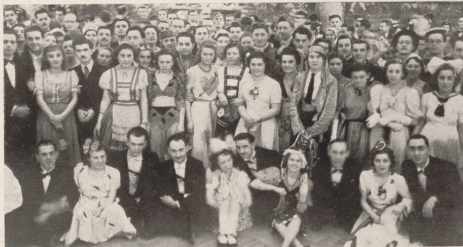
A Háromszéki bál jelmezes közönsége.

Megcsappant az idegenforgalom befelé és kifelé. A magyarok nem utaznak ezidén külföldre, Ausztriát is elhanyagolják, ezért van tele a Kékes. (Hetek óta egyetlen szoba sincs üres.) Pedig nem is volt igazi tél, a sí rajongóinak leg-