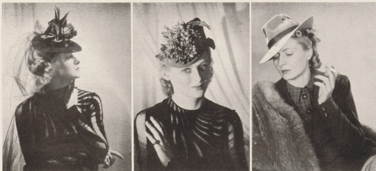
Jean Patou modelljei. Közli: Zsubory Nelly.

— „Mu, mu-u-u...” — mondja Annerl. Más nem is mond. Minek is, amikor ez a „mu-u-u” olyan kifejező?