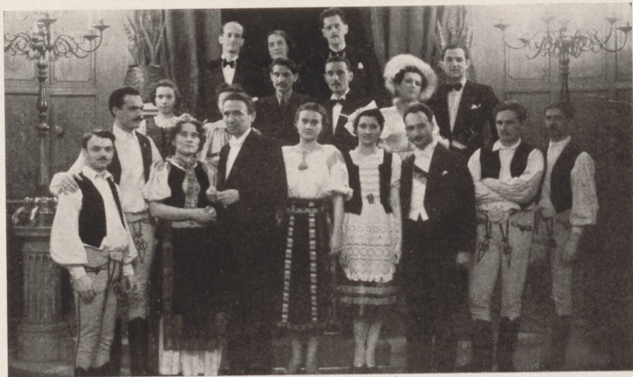
A Háromszéki bálon: Erdélyi népviseletben.

Szép és jó szőrmét DEÁK és HORVÁTH szűcsök, királyi udvari szállítóknál Budapest IV, Váci-utca 13 vásárolhatunk.