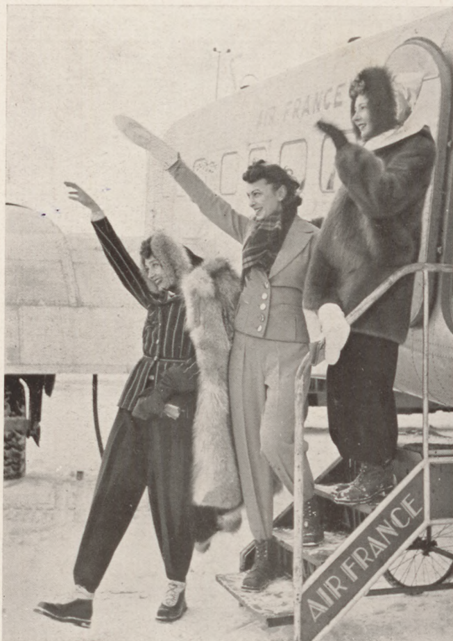
Start a párisi repülőtéren

Báli tudósítók, estélyi riporterek, nagyobb összejövetelekre kiküldött hírlapírók sohasem sajnálják a pennájukat, ha a