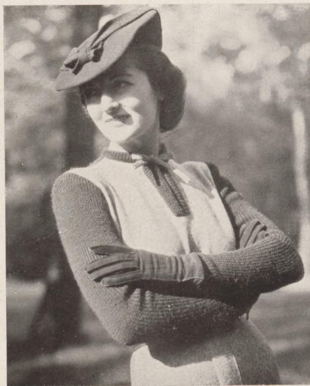
Drapp-barna jersey sportruha barna sapkával Patou kollekciójából Közli: Zsubory Nelly