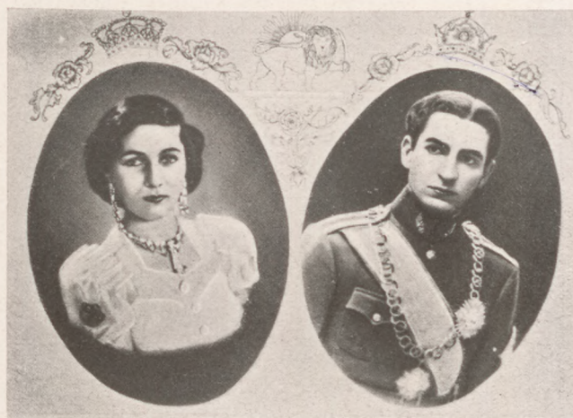
Az iráni trónörökös és menyasszonya Favziah egyiptomi hercegnő

Egyszer jobban ment a sora, máskor rosszabbul. Mostanában — sajnos — csapnivalóan rosszul. Esztendeje alig győzött kölyköket szerezni, most meg — mintha csak valami kutyaellenes szövetségbe tömörültek volna a vevők — senki-