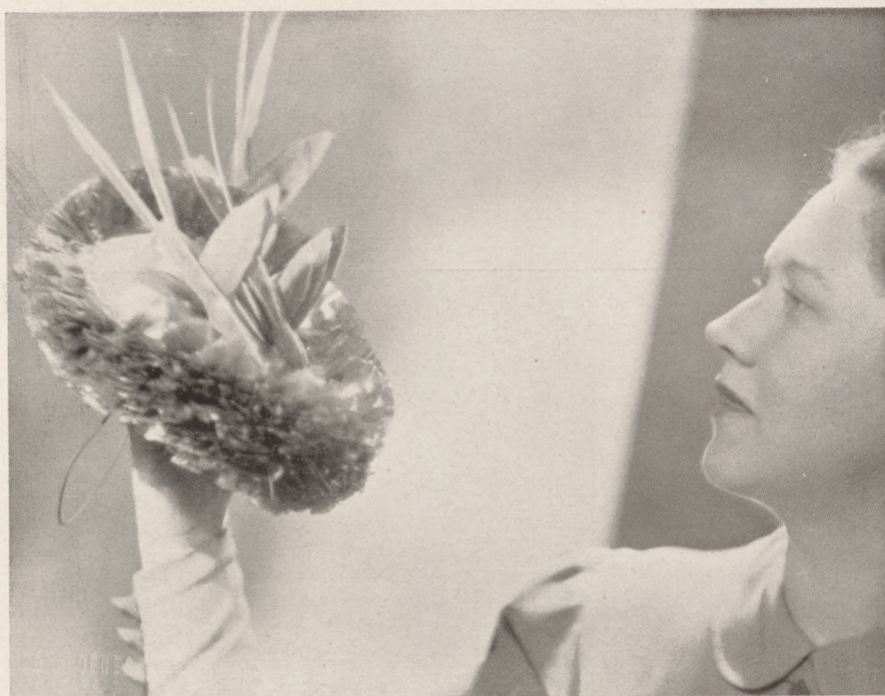
Sopousek Carola kreációja: Kék celofán koktél kalap madarakkal