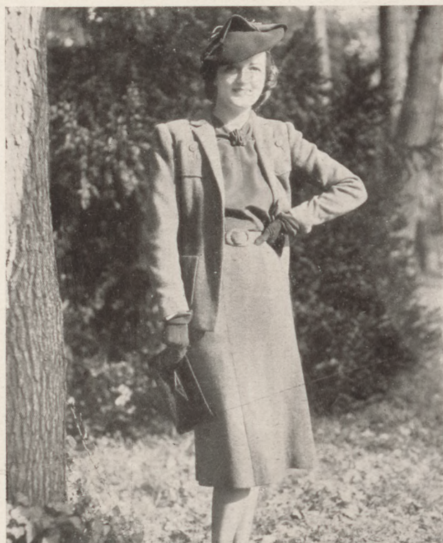
Szürke jersey kosztüm barna selyem blúzzal Patou kollekciójából Közli: Zsubory Nelly