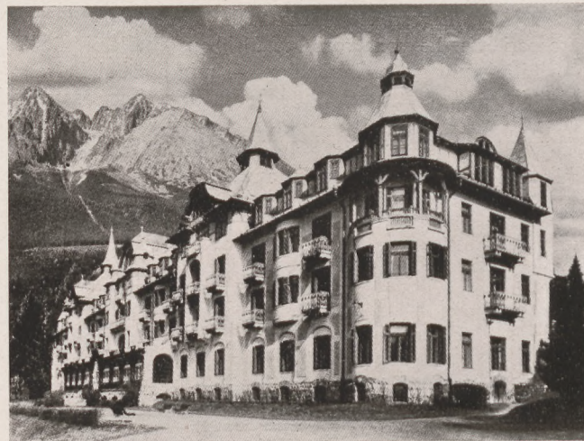
A tátralomnici Grand Hotel (a volt Palota-szálló).