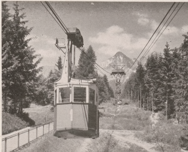
Tátralomnic: Fűggyvasút a lomnici csúcs felé.

Néhány év óta az idegenforgalom Magyarországon is előlépett elsőosztályú közgazdasági tényezővé. Nem is olyan régen ez csak másodrendű kérdés volt, nem törődtek vele, csak a lapok riportoldalai számoltak be olykor egy-egy érdekesebb vendég érkezéséről. A jó közönség azonban legelőször azt sem tudta, hogy az úgynevezett idegenforgalmi