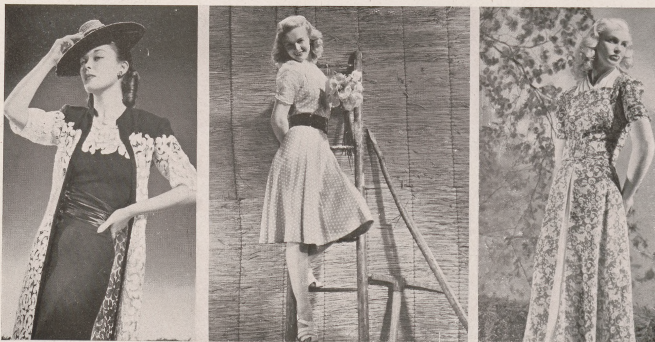
Lucien Lelong kollekciójából: 1. Sötétkék crep fehér csipkével kombinált komplé. 2. Rózsaszín, fehérpetyves vászonruha, orqandi blúzzal. 3. Fehér-kék mintás délutáni ruha. Közli: Zsubory Nelly.

igazán nincsenek, tavaly óta nem épült semmi, a koszt ugyanolyan gyatra, a vendég esetleges panasza most is falrabányt borsó (tisztelet a nagyon kevés kivételnek). A Balaton azonban mégis csak a Balaton, szeretik, egyre népszerűbb lesz és valljuk be őszintén, aki vizet akar, az mégis itt érzi magát legjobban. (Miatán úgyse járogatunk külföldre ez idén annyian, mint más években.) Mi van még a Balatonon kívül. Mint már megírtuk, az új gallyatetői szállodában szeptember közepéig nincs szoba, zsúfolt a Kékes, Radvány, a Kassa melletti Bankó-füred, tömegek utaznak Szegedre az ünnepi játékokra és azt mondják, Lillafüreden is vannak vendégek. Meglepően sokan mentek Kárpátaljára. Itt azonban nagy családás várt mindenkire. Az a pár szálloda, amit a csebek építettek, primitív, kezdetleges és alig van férőhely. A vidék pedig remek, nem ártana, ha a vállalkozók felfigyelnének az új konjunkturára és legalább nyári tartózkodásra alkalmas rabitz-épületeket, vagy favázás házakat húznának fel jövőre. Pesten pedig pesti nyaralók vannak szép számmal, akik a városi lakásból szívesen mennének valami hűvösebb környékbeli hotelbe. (Húsz pengő egy szoba a Svábegeyen!)