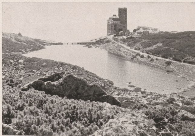
Tátralomnic: Kőpataki tó, a függővasút-állomás és szálló.

Őszre elkészül a drótkötélpálya folytatása, fel a 2630 méter magasságú lomnici csúcsra és ezzel verni fogják az összes eddigi „csúcsteljesítményeket”. E szédítő magasságban még vendégszobák is épülnek azok részére, akik a csodálatos