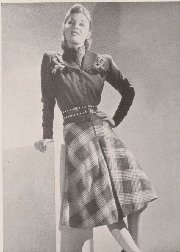
Kérszes ruha Raphaël kollekciójából.