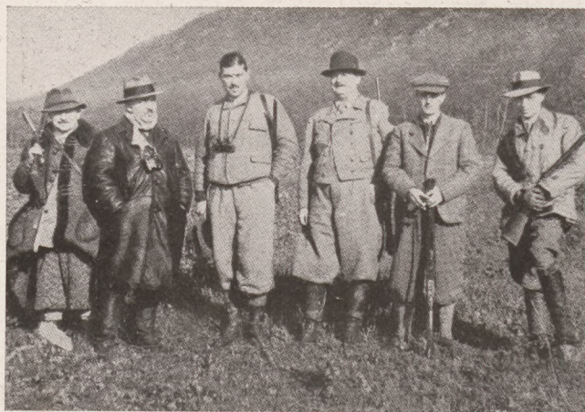
Erdei hajfáson a Bakonyban.

A KORMÁNYZÓNÉ ez évben is kérő szóval fordul az ország közönségéhez. Itt az ősz, közeledik a tél, az országban sok az elesett, nincstelen szegény ember. A kormányzóné nyomorenyhítő akciója évről-évre visszatér ilyenkor ősz felé, mert fel kell emelni azokat, akik a földre hullottak. Ruha kell, élelmiszer, tüzelő, sokszor pedig gyorssegély azoknak, akik erre olyannyira rá vannak szorulva. A társadalom mindig tudta kötelességét és tudni fogja ezután is, most, amikor minden segítségre még fokozottabban szükség van.