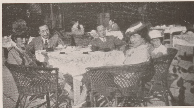
A budapesti japán követség tagjai és családjuk Kékesen

Elkészült az egyik pesti karosszéria-gyárban az első magyar camping-pótkocsi. Az összkomfortos mozgólakásban minden megvan, ami egy zavartalan weekend eltöltéséhez szükséges. Kis konyha, ágyát átalakítható süppedő fotel, villanyvilágítás, miniatűr fürdőfülke, vízvezeték, rádió, bridzstasztal, sőt még csónakgarázs is (a car tetején). A remekmű