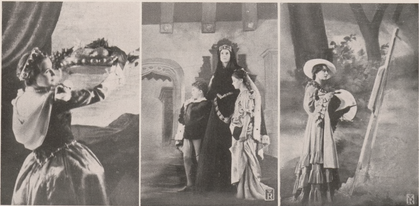
1. Tizian: Lavinia (gróf Andrássy Ilona). 2. Madarász: Zrinyi Ilona (Vásárhelyi Marqit, ifj. Eckhardt Tibor, Keresztes-Fischer Mária). 3. Ferenczy: Festőnő (Ghyczy Jenőné),