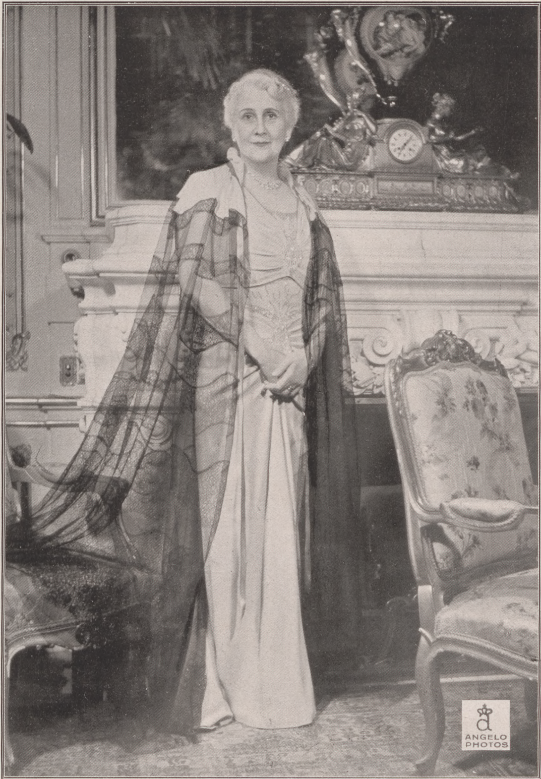
Horthy Miklósné az Operaház díszelőadásán