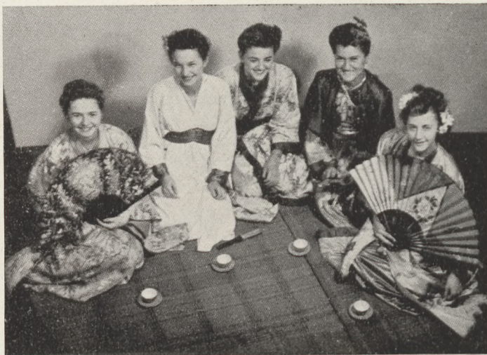
Műkedvelő est a MAC kertünnepélyén: 1. Strauss-walzer. 2. Japán tánc. (Névsor a szövegben.)