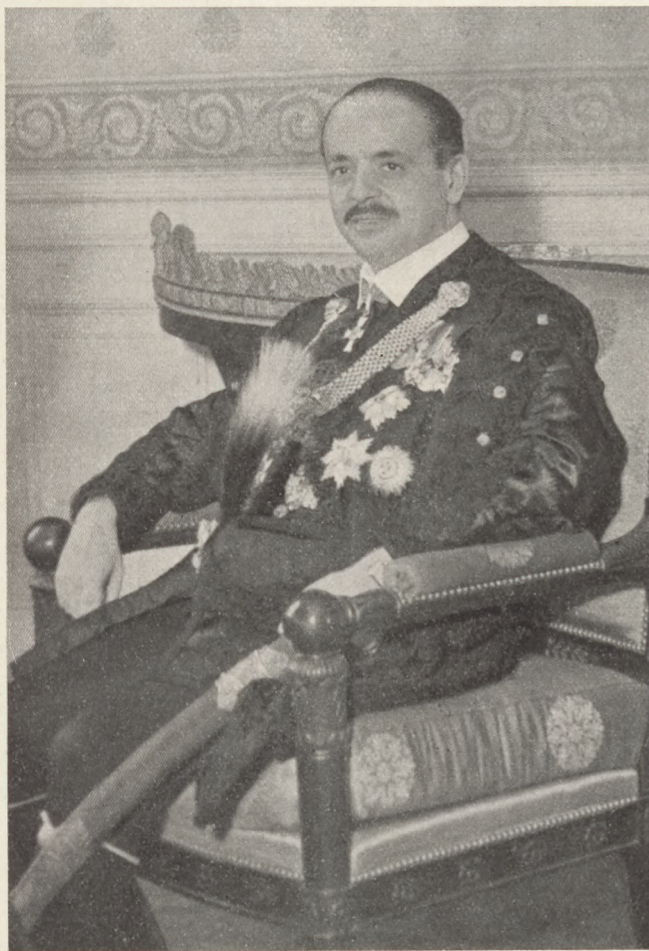
† Gróf Csáky István

kezelés alatt állott. Páratlan akaratereje azonban szinte legyőzte a betegséget, úgy dolgozott, olyan munkabírással, lendülettel, mint kevesen mások, a munka szinte minden percét igénybe vette. Nemrégiben nősült, azelőtt jóformán alig volt magánélete. Egyre halmozódtak a feje fölött az ország gondjai — a mai időkben külügyminiszternek lenni a világ legnagyobb feladatai közé tartozik. De Csáky István bírta a tempót. Akik ismerték, a zseniális ember mellett a páratlan kozört is látták benne, a társaságbeli urat, aki mindig készséges, minden helyzetben, mindenki számára van ideje, egy kedves szava — könnyed derűvel intézett el óriási problémákat. Tragikus összeroppadás követte ezt az évtizedek óta tartó lobogást, a szív és az emberi gépezet többi kerkei egy nap kifulladtak a tempóban. Nagy ember volt, a nagy magyarok közül való,