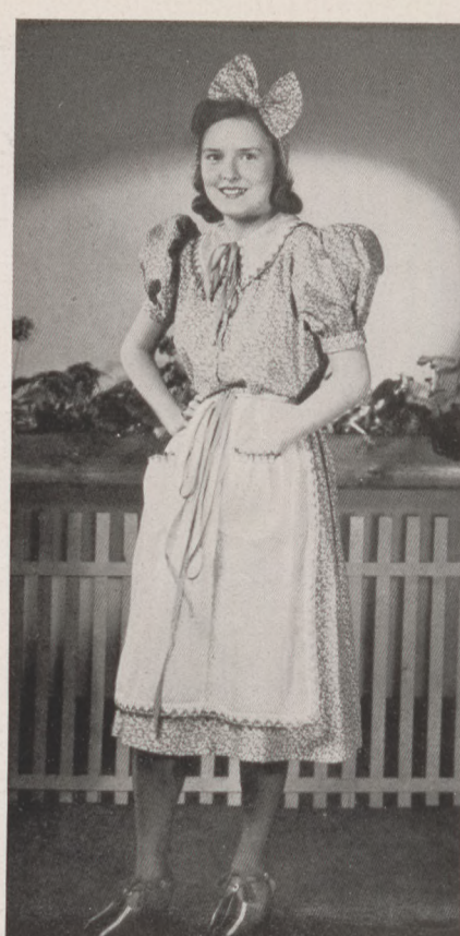
3. Egyszerű karton viganó.