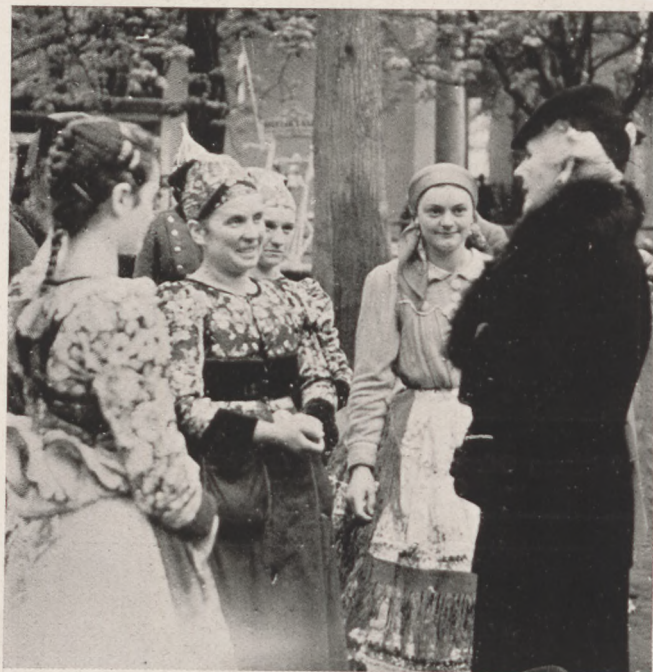
A Nemzetközi Vásáron: A Kormányzóné a Népművészeti Pavillon előtt.