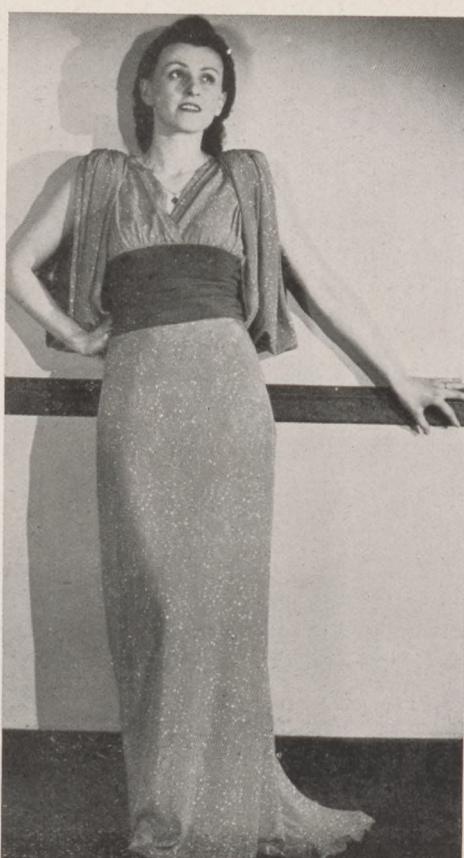
2. Kalotaszegi írásos mintájú emprimé ruha