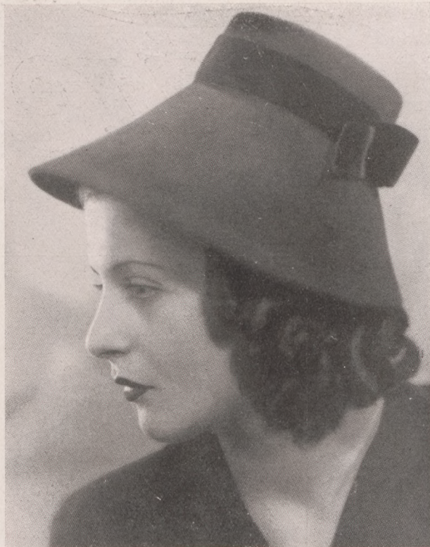
Sopausek Karola (IV., Váci-utca 17) legújabb vonalú délutáni nyulször-kalapmodellje

LEVÉLPAPÍR ÉS PAPIRSZALVETTA újdonságok Cílcser papírüzlet, Budapest, V., Dorottya-utca 9.