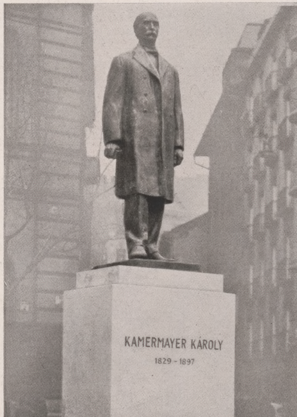
Kamermayer Károly, Budapest első polgármesterének szobra. v. Szabados Béla alkotása.