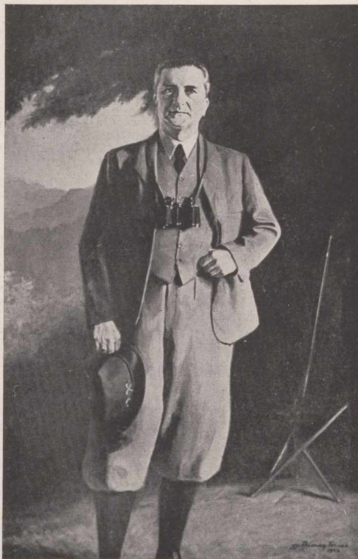
Horthy Miklós, Magyarország Kormányzója