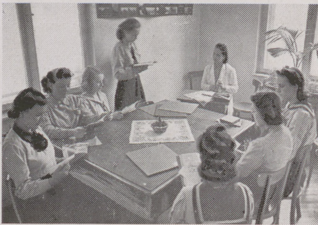
Gyakorlati beszélni-tanítás német, v. angol, v. olasz, v. francia nyelven.

SZÁVAYNÉ HALÁSZ ANNA kozmetikai intézete, VI., Teréz-körút 1/b. Telefon: 425-020. Mindennemű arcápolás, szépítés, kikészítés. Ingyenes tanácsadás.