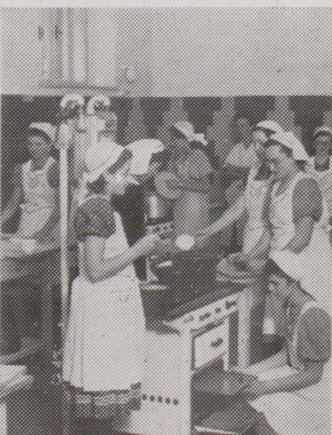
Családi életre is felkészülnek a jövő üzletasszonyai.