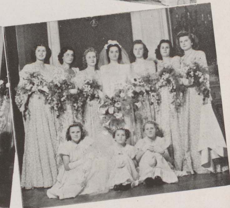
(Neveket lásd a Hymen hireknél)