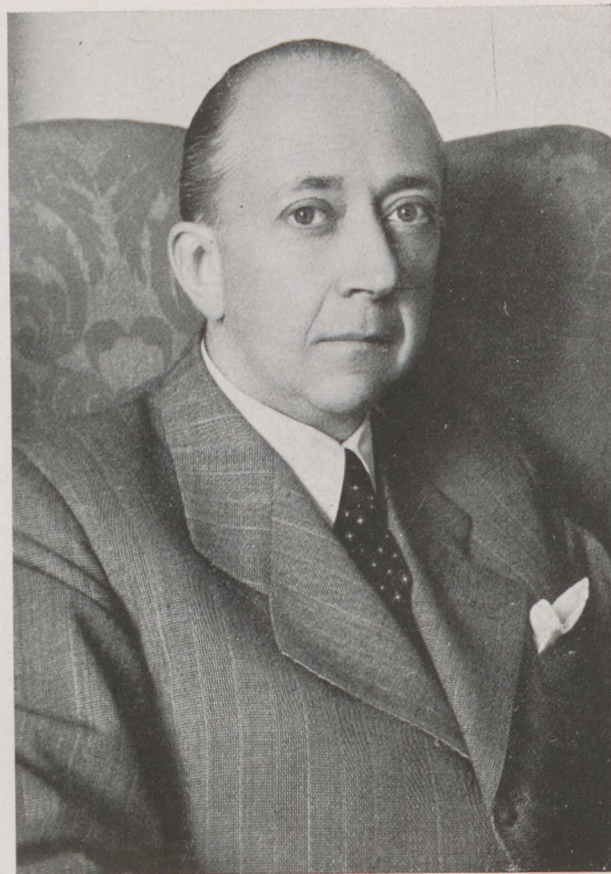
Gyhycy Jenő külügyminiszter

DANYI látszerésznél, Budapest, Vörösmarty-tér 6. T.: 185-318