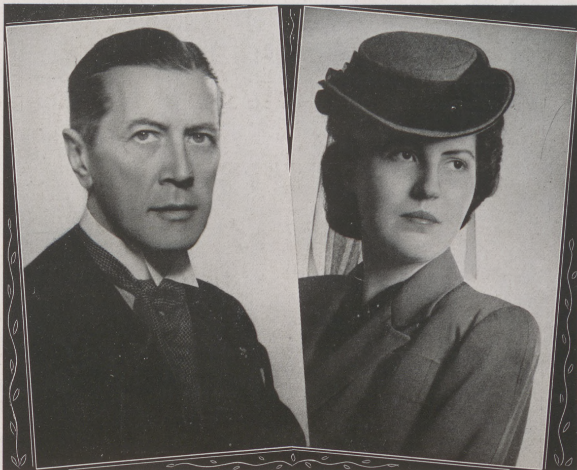
Gróf cosbani Bem Vladimír és felesége Basselet de la Rosée Erzsébet német-szentrómai birodalmi grófnő