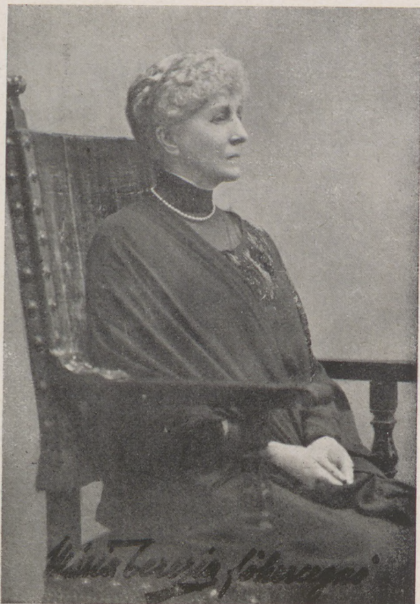
Mária Terézia főhercegnő †

MÜLLER RÁDIÓ V, VILMOS CSÁSZAR-ÚT 60. TELEFON: 123-088