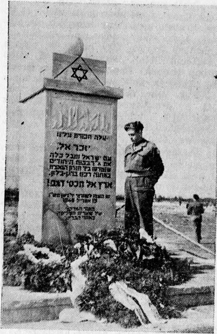
A zsidó brigád katonája a haláltábor helyén emelt emlékműnél

„oj, sze brennt, jiddelech, esz brennt, unser orem stéil nebach brennt...” és a Generaloberst Freiherr von Fritsch dolgozószobájában, ahol a lengyelországi hadjárat tervét dolgozták ki Jaszl útt, az apró bendini zsidó, az új KZ-karrier