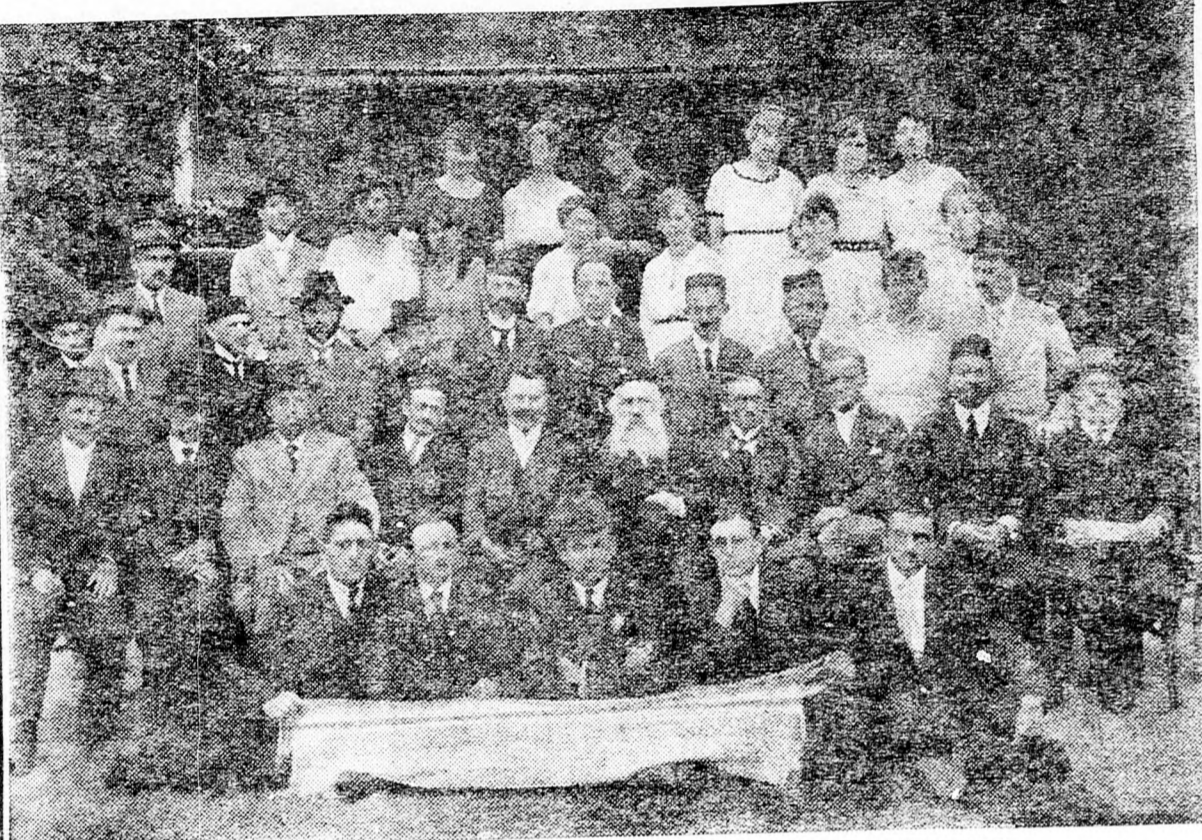
AZ ELSŐ ERDÉLYI ULPÁN RÉSZTVEVŐI 1920-BAN

Ha valaki egyszer meg fogja írni az erdélyi zsidóság történetét, akkor az erdélyi első Ulpán is úttörővel bekerül a lapokra, hogy hirdessék a héber nyelv feltámadását.