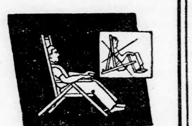
Természetes, kényelmes ülés — hála biztonságos szerkezetének.