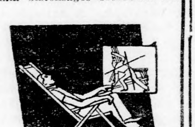
Önműködő szabályozás minden helyzetben, üléshez, fekvéshez.