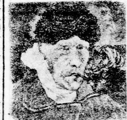
VINCENT VAN GOGH

Vincent Van Gogh születésének századik évfordulójára Hágában kiállítás rendeztek a nagy festő műveiből és összegyűjtött szellemi hagyatékából. Fényképek mutatják Van Gogh lakóházát, családját, levelek, jegyzeteket, apró rajzfüzetek, ja-