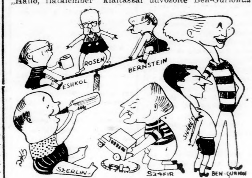
Minisztereink — ahogy dr. Malan látja őket.