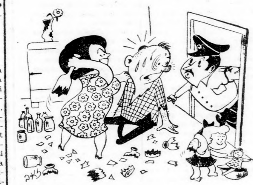
... nincs semmi baj biztos úr, csak a feleségem gondoskodik a nyomorgó üvegyárakról.