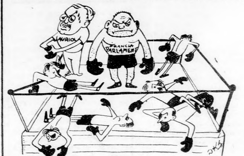
... Ajjaj, ügylátszik végül is nekem kell kiállnom ellene...