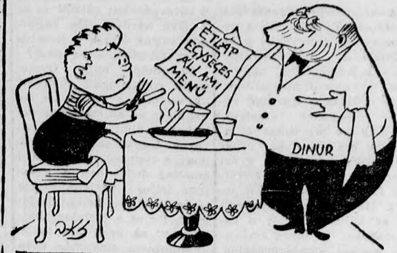
— Italt tetszése szerint választhat: van kóser bor, vörös bor és Coca Cola...