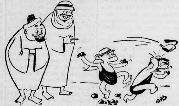
— Mit szólsz, chábub, ehhez a kölyökhöz? Biztosan légionista lesz belőle...