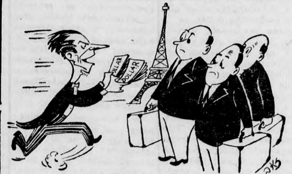
— Drága uram, könyörgöm... minden pénzt megadunk... k.p. fizetünk... adjanak egy... jó, tartós miniszterelnök-jelöltet...