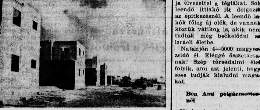
A NATANJAI HOH SIKUNJA

A natanjai magyaryelvű zsidóságnak évek óta legnagyobb gondját a lakásprobléma képezi. Natanja tipikus oléváros, ahol a lakosság legnagyobb része olyan polgárokból áll, akik csak néhány évvel ezelőtt érkeztek az országba és még nem sikerült, főként lakás tekintetében, véglegesen elhelyezkedniük. A Hitachdut Oléj Hungaria natanjai csoportja, amely mindig is az ország egyik legagilisabb magyar-zsidó közössége volt, évek óta nagy erőfeszítéseket tesz, hogy konstruktív módon legyen segítségére a magyar zsidóknak lakásproblémájuk megoldásában. Ezenfelül más kisebb csoportok is szerepelnek a bevándorlási listán. Harold Stassen, a kölcsönös segélyprogram igazgatója tegnap a menekültügyi és bevándorlási osztály helyettes vezetőjévé Hugo Carusit nevezte ki, aki addig az UNA összekötője volt az UNO menekültügyi főmegbízottjánál Genfben. — Carusi így Dorothy Howton, a menekültügyi osztály ismert vezetője mellé kerül. Ők lesznek a felelősök Eisenhower elnök menekült-bevándorlási programjának végrehajtásáért és ők tartják fenn az összeköttetést a menekültekkel és kivándorlással foglalkozó nemzetközi szervekkel is.