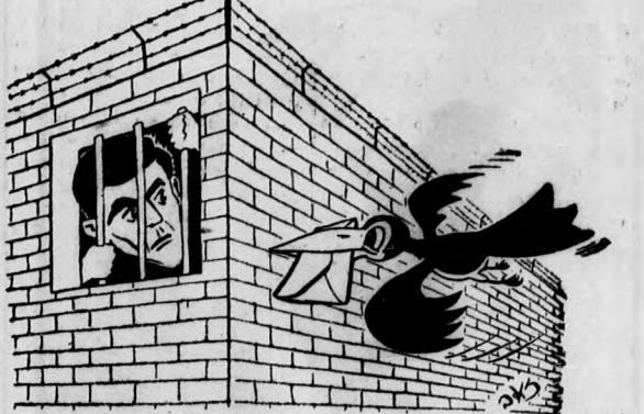
Orennek a levél Prága városába, Örméhrt viszen a szomorú fogságba?