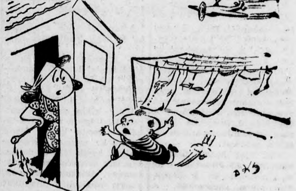
Anyuka, szedd be gyorsan a ruhát, jön az eső!