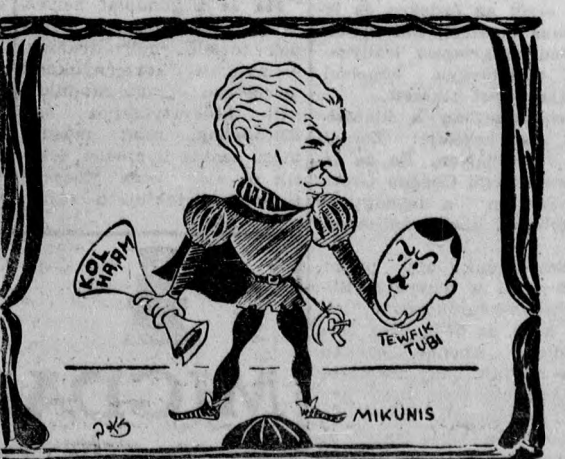
Hamlet: — „TUBI or not to be...” (Lenni vagy nem lenni...)