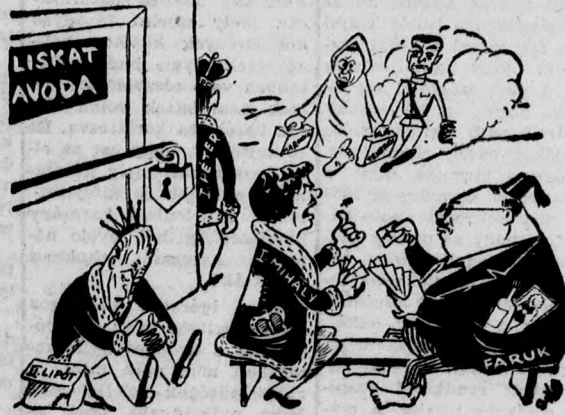
I. Mihály: — Rémes ez a munkanélküliség! Már megint kettő...