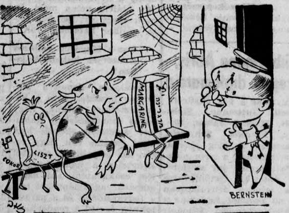
Türelem, gyerekek! Már csak egy félév...