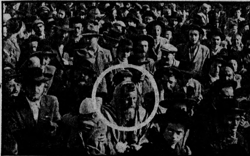
REB AMRÁM BLAUT A HÍVEK A TEMPLOMBA KISÉRIK