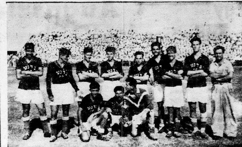
A győztes telavivi Gadnalabdarúgó csapat, amely megnyerte az idei dr. Körner kupát.

családi lenző- SZALLODA ATADÓ, esetleg bérbeadó. — Bő-vebbet: Grünberger hir-dető- és jegyiroda, Haifa, Schapira 13. Tel.: 2453