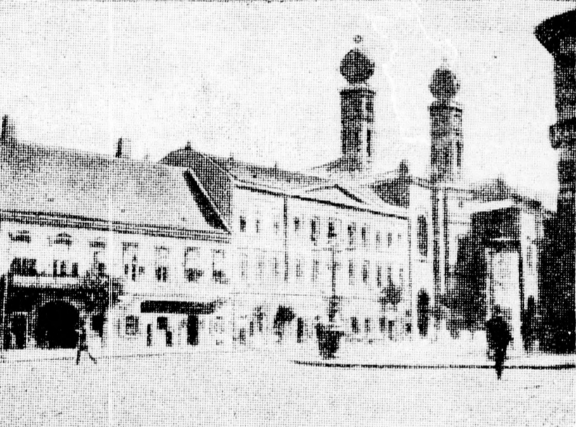
HERZL TIVADAR BUDAPESTI SZÜLŐHÁZA

multkor Gömbös Gyula biztosított erről. Kedves bátyám — mondotta — légy nyugodt, nem fogunk a zsidóság dolgában mit sem tenni anélkül, hogy veled előzőleg megbeszéljünk az ügyet!” Mikor azonban elkövetkezett a rettentő vész ideje, ki gondolt még akkor Szabolcsi Miksára és mindazokra, akik a népet évtizedeken át ámitották és tudatosan félrevezették, akik folyton a hazát mentették a cionisták elől, akik becsmérelték, beárulták a zsidó nép állam-