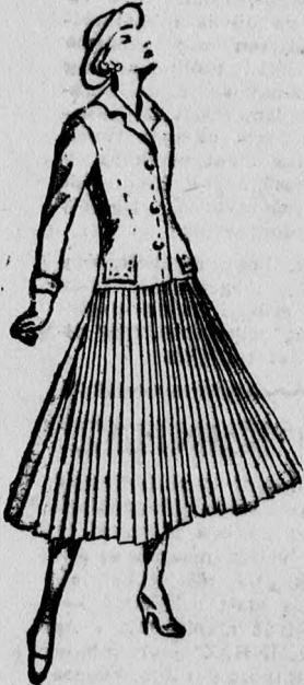
Christina Dior „ANGLOMANIE”

A derékvonal csak könnyen van jelezve, sohasem kihangsúlyozott. A bemutatott hatalmas sikert aratott és az eleganciához szokott párisi „haut volé” nem számít meg taposni. A termékek és bejáratú lépcsők is tömve voltak nézőközönséggel és a levegő terhes volt a parfüm és virágillattól. Legszébb darabja az „Anglomanie” című együttes volt, amely a híres „A”-vonal prototípusa: Berakott szok-