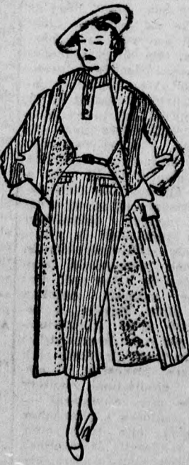
Pierre Balmain „CANDY”

Ha ná hallgattunk, akkor a nő az idén oskios kosztümöt, csíkos kis ruhákat hord, úgy gyapjában, mint selyemben. A legszivebben világos paszell-színeket sárga, rózsaszín, türkizkék, beige, söt fehéret alkalmaz. Ő a kosztümöket a természetes derékvonallal mutatja. Balmain-nek a legszebb kombinációja, „Candy” egy rózsaszín-fehér csíkos szövtruha, kishé hosszított egyszínű rózsaszín derékréssel, ehhez a ruha anyagából egy hosszú kabát is elegáns nagy fehér állkalap.