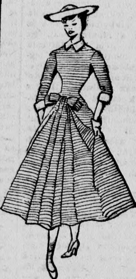
Jacques Path „PRÉLUDE”

Halála után, felesége Genévle tovább vezeti a szalon és bemutatja a régi tradíciókhoz híven komoly eseményre volt a divatvilágnak. Nagyon nőiesek, nagyon elegánsak a ruhái. Az egyszerűbbek mindig fehér pikével díszítettek. A nyári és estélyi ruhákban a derékvonalat könnyedén lejjebb helyezte és a szoknyáit „könnyelműen” bőveket. — Egyes csinos részletek: kis piké masnik a kosztüm manzsettákon, a kihajtokon jobbra és balra brossok. A legszebb egy nyári ruhája volt, amelynek neve „Prélude”. Ez egy szürke-fehér csíkos taftruha, bő szoknyával és fehér piké-garantúrával díszítve.