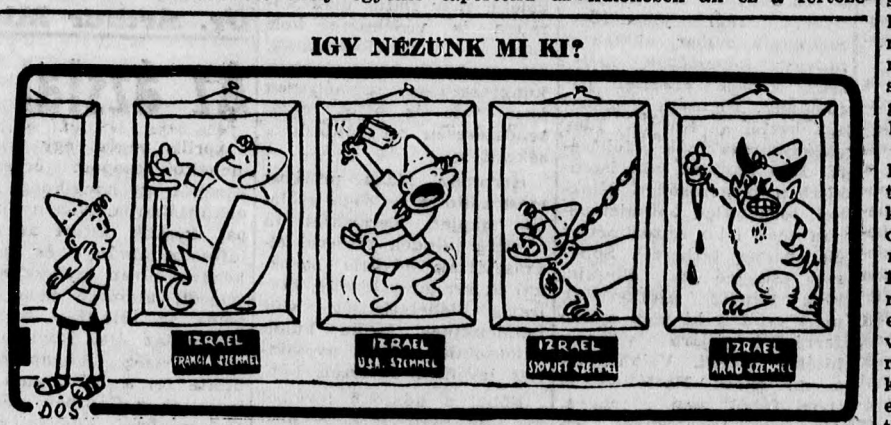
Ahogy Izráelt látják... COPYRIGHT BY MAARIV

Vitaminpolyók, (múszli): Egy dl. tejet 2-3 kanál cukorral fel főzünk, ezzel 3-4 kanányi zabpehelyt leforrázunk. Ha kihűlt, hozzákeverünk egy citrom levét, pár szem megáztatott aszalt-szilvát apróra vágva, öt dkg. darált diót, avagy földi mogyorót (botnint) és öt dkg. mazsolát, vagy datolyát apróra vágva. Apró golyókká formálva tálaljuk. Utótóták látóáa aaej-neem