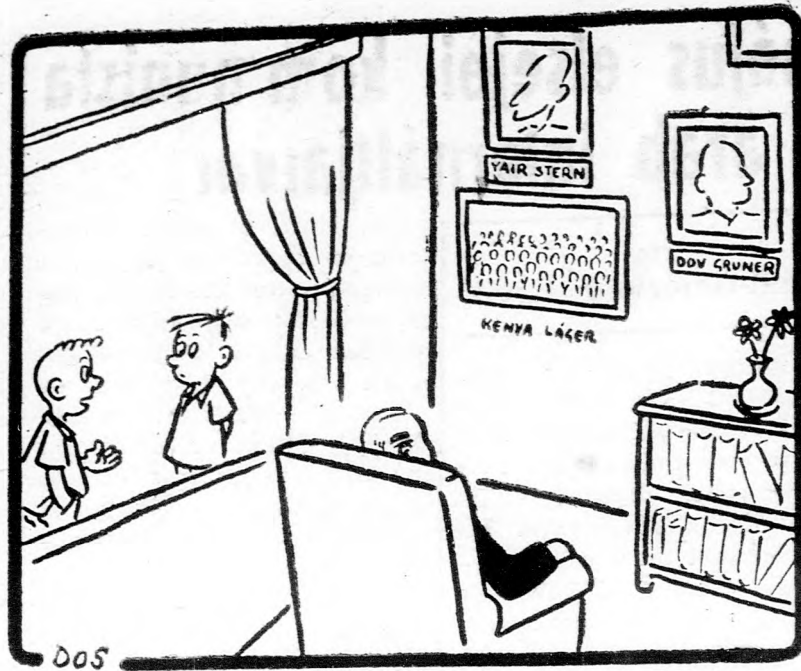
— Mit vágsz fel úgy az apáddal? Hiszen még Hágáná-érmét sem kaptott!