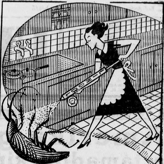
Tisztítsa meg konyháját a dszukotól, amelyek a betegségeket terjesztik. Permetezze az élelőanyagokat „LINDOL”-al, amely megsemmisíti az összes férget a házban.

A bizottság határozata értelmében reggel fél 8 és fél 10, valamint délután 3 és éjjel 12 óra között a Dizen-