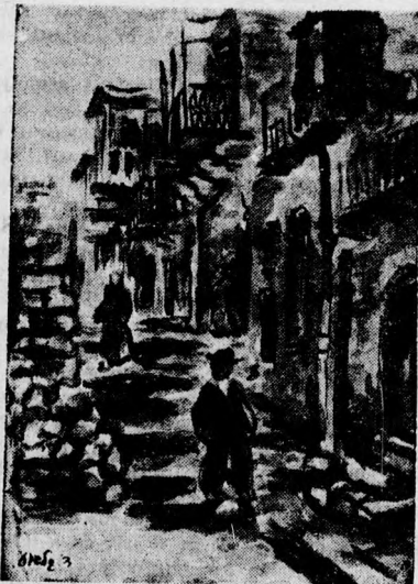
Gilboa: Cfáti utca

Képzőművészeti Akadémia fiatal végzettje alijjázott Petroszényből. Két évvel ezelőtt egy öthónapos turné keretében, Pá-