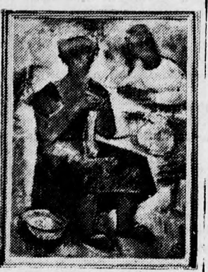
Alexander: A kötő nő

Risonban és Rechovoton van festőiskolája és a nyári hónapok alatt tartja nyitva