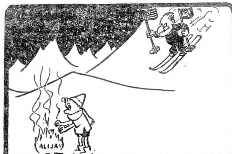
Az arabok széleskörű kampányt kezdtek az alijja ellen (A sajtóból)