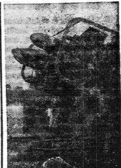
A francia gyártmányú „SS-10” irányítható rakéta

A Kelet-Berlinben lefolyt bűnpernek csupán azért van jelentősége, mert a tárgyaláson számos tanút vonultatottak fel, akik igazolták, hogy Oberlaender 1933 óta volt a náci-párt tagja és a világháborúban „Ober-