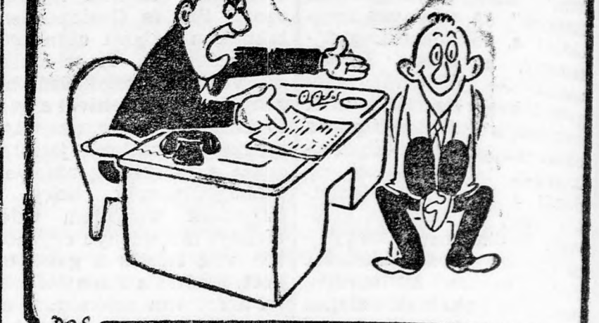
— De hát ez hamisítva van! — Igen. Az a hobbyim.

(Köztisztviselőket köteleznek egy kérdőív kitöltésére, mely személyes ügyeik iránt érdeklődik, — többek közt a „hobby”-juk iránt.)