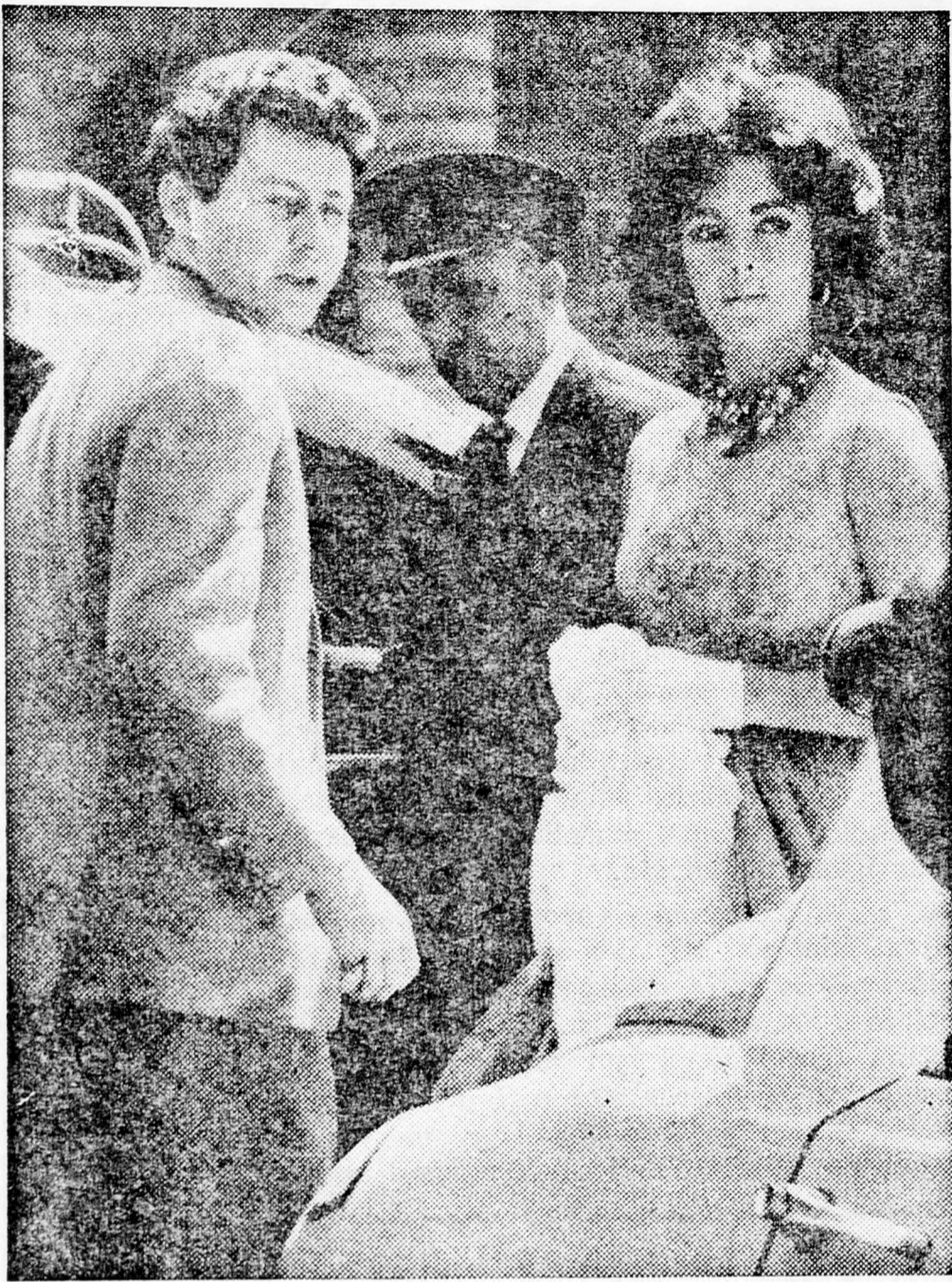
A betegség előtti utolsó kép: LIZ és FERJE LONDONBAN

gépelt rendelkezésre állítani, hogy a nagy színésznő életben maradjon.