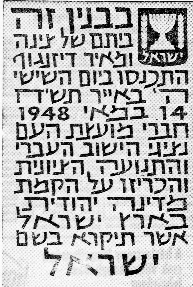
Az emléktábla szövege, amelyet a telavivi múzeum falán helyeztek el a zsidóállam kiáltása emlékére

A vészidőszakban Izrael nem volt képes megvédeni bennünket. Nem volt meg hozzá az ereje.