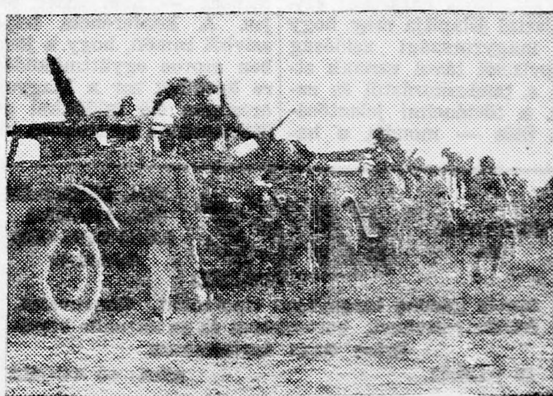
A Hágáná egységei elindulnak Beer-Séva meghódítására (1948)