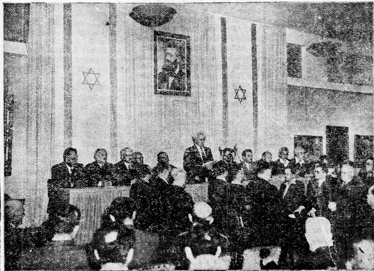
A ZSIDÓ ÁLLAM KIKIALTASA A TEL-AVIVI MUZEUM ÉPÜLETÉBEN — Ben Gurion felolvassa a Függetlenségi Nyilatkozatot —

Eichmann több vonatselelvény zsidó utasának befogadását követelte, de végül is „kiegyezett” Hósszal, hogy egyik nap két, másnap három (Folytatás a 2-ik oldalon)