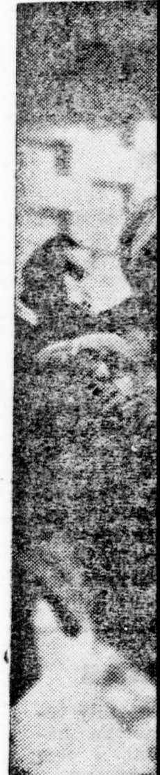
„Bluthund karzatárol származás

A védőn ban Haus fejtette, gyilkosság náci által sét azért nyitania, már önmá ja, hogy