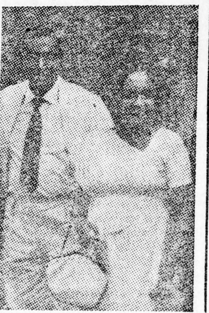
Bandaranaike asszony és unokafivére Félix

Egy millió ceyloni tamil, akik az indiai félszigetről több mint kétezer évvel ezelőtt vándoroltak be, de akik még mindig saját nyelvüket beszélik és a hindu vallást gyakorolják, közel áll a nyílázadáshoz, amiért a kormány a sinhalát, a 6,750.000 főnyi buddhista