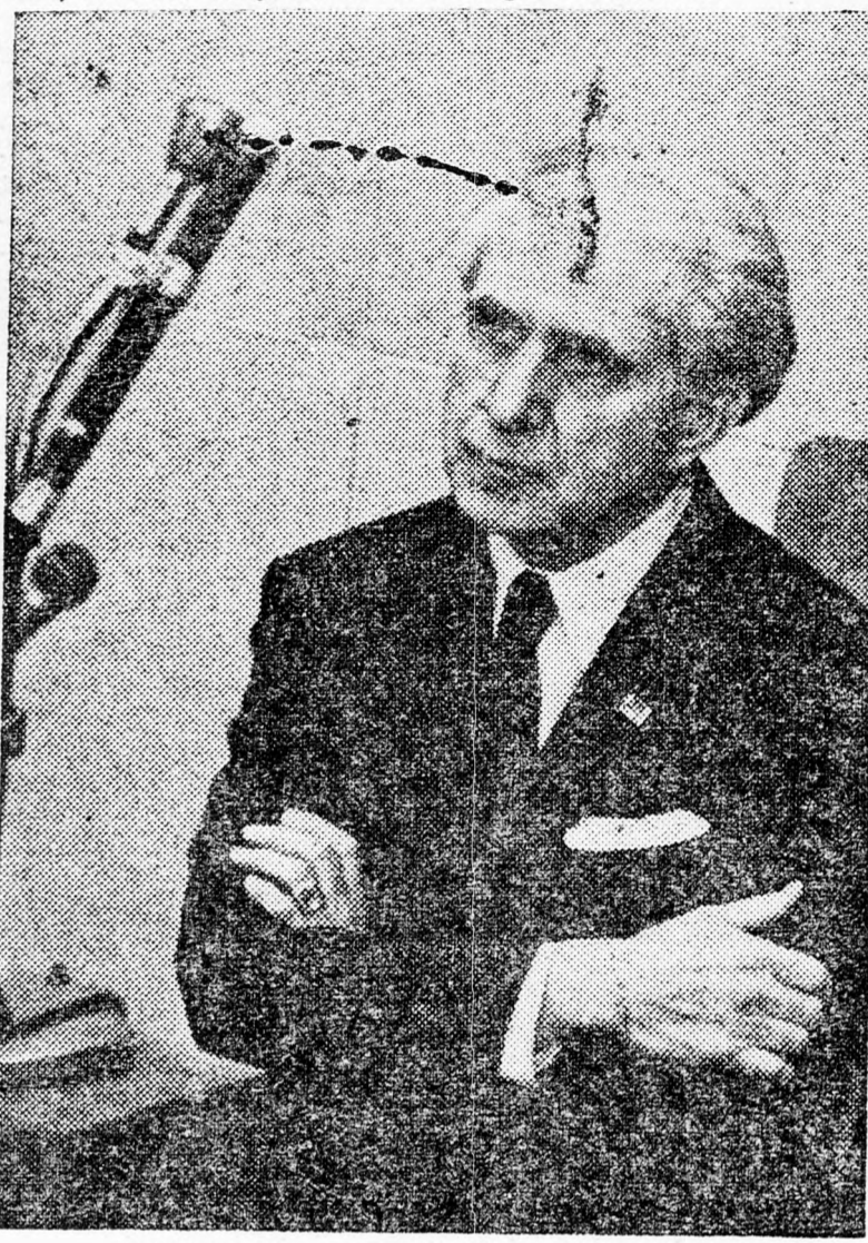
MICHAEL A. MUSMANNO FŐBÍRÓ, aki a náci gyilkosokat halálra ítélte

Musmanno főbíró impo-náló jelenség. Magas férfi, dus, hófehér hajzattal. Sze-