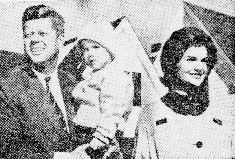
John, Caroline és Jacqueline Kennedy