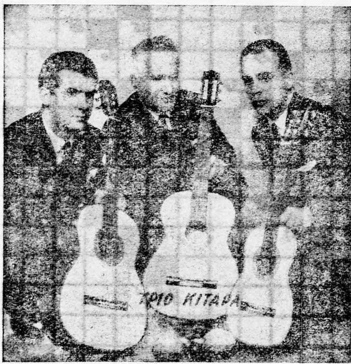
A világhírű görög gitár-trió