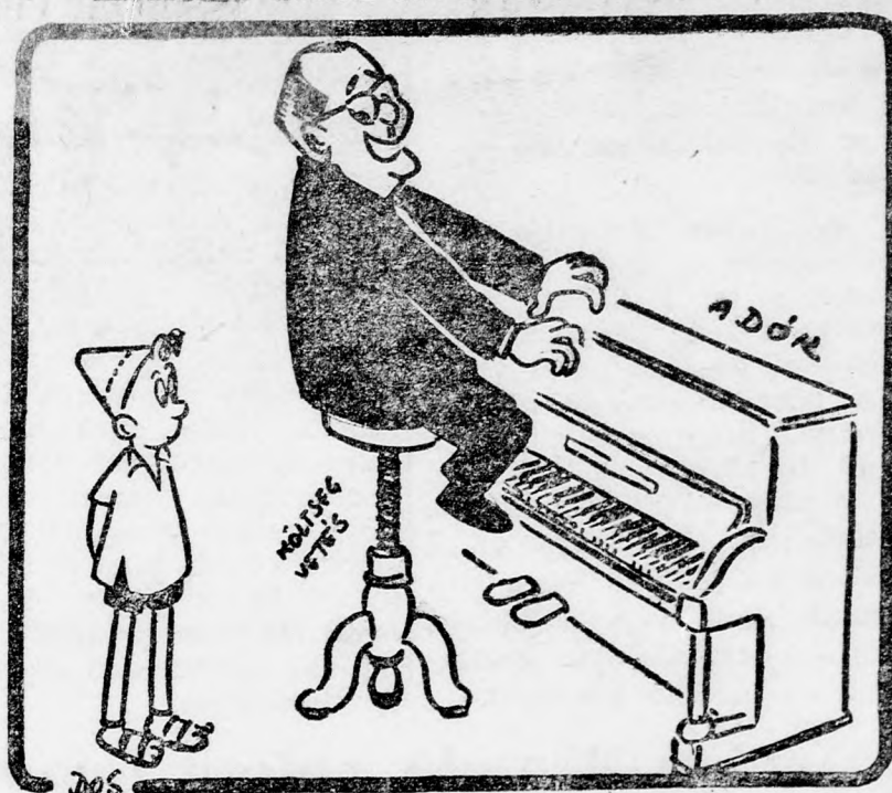
— De akkor hogy fog játszani?