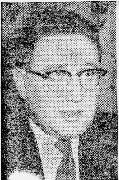
Prof. HENRY KISSINGER

— Túl sokat törődünk azzal, hogy különböző lépéseink hogyan fogják érinteni az amerikai presztizst külföldön. Hagyjuk, hogy kisállamok befolyásolják a távozatainkat, ahelyett, hogy a rendelkezésünkre álló legjobb utat követnénk.