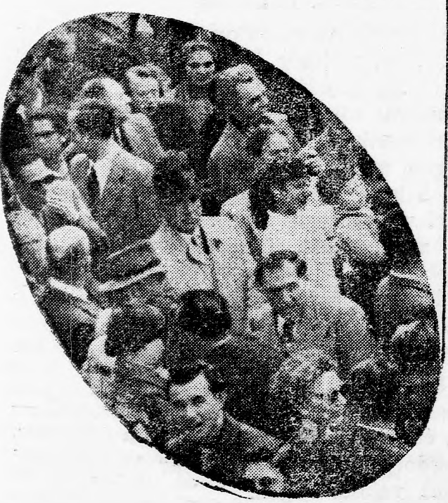
Az országban rendezett közvéleménykutatáson —

magy szótábsággal az „Amcor” rádiót választották, mint a legkeresettebb rádiót az országban.