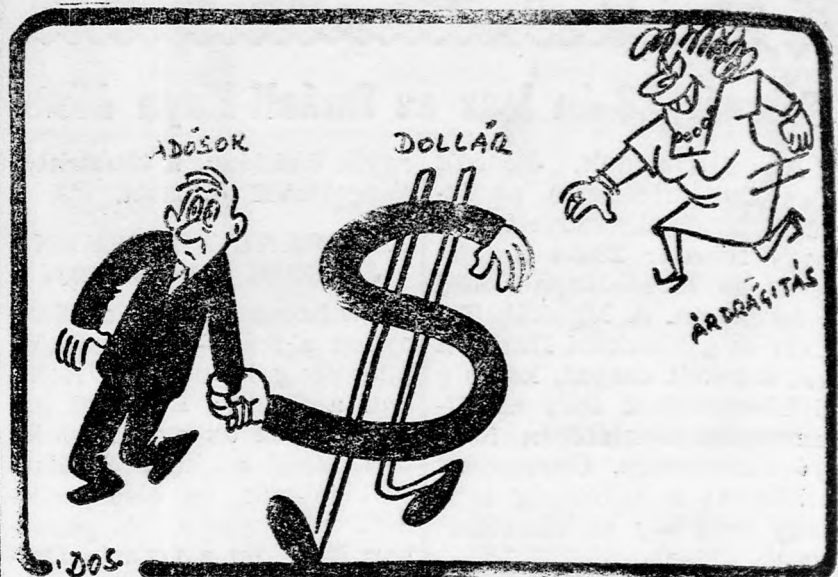
(„COPYRIGHT BY MAARIV”)