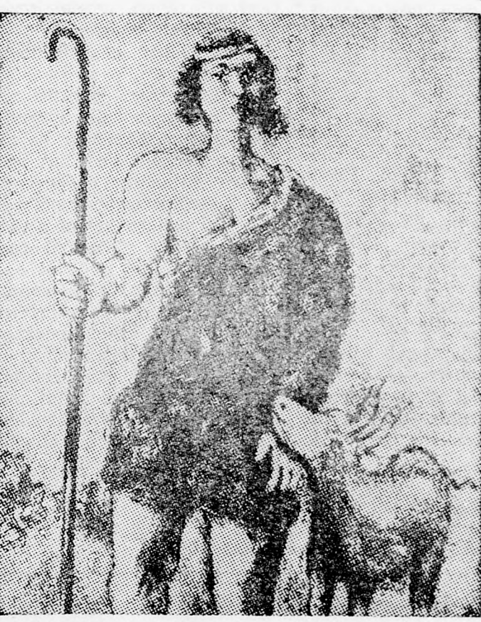
CHAGALL: József a nyáját őrzi

Az „Ablakok” építészeti hordozó felülete is kifogásolható: a templom térsége kicsiny! A temérdek szín, optikai és művészeti hatás, melyeket az „Ablakok” árasztanak, az arra érzékenyeket az élmény szempontjából túlperzseltetik, mint a roncsoló röntgen a túladagolt dózis esetén. Az üvegablakok hatásának helyes kihasználásához nélkülözhetetlen a „felocsúdási felület”, az ablakok közötti megfelelő válaszfal rész. Ezt a gótikus dómok színes ablakainak tervezői (pld. a ciszterciák) tudták és alkalmazták! Chagall mentiségére szolgáljon, hogy őt a dr. Jozsef Neufeld építész által kivitelezett zsinagóga már kész tények elé állította. Így vette át dr. Mirjám Freund a Hadassza amerikai elnöknőjének a rendelését: 12 drb., egyenként 3 m 38 cm magas és 2 m 51 cm széles vitrázs elkészítésére. Segítője, Charles Marq, 1960 júliusában itt járt. Ő és Brigitte Simon Marq, a reimsi műhelyekben színessé áldották és anyagba varázsolták azt