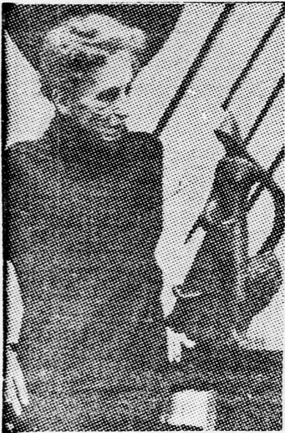
ISAK DINESEN (Karen Blixen) író

Az Isak Dinesen írói álnevét nyugott Karen Blixen bárónő, dán származású író nő rejtőzik. A törékeny alaku, 80-ik évében jár, ma már általánosan ismert Blixen bárónő évtizedeken át élt Afrikában, ahol kávéültetvényei voltak, bölénycsordára vadászott és még az ősalapítványban lévő Afrikának sok veszélyt jelentő kalandos életét élte. Ottani farmján eltöltött éveit írja meg „Out of Africa” című munkájában. Karen Blixen a sokféle forrásból merített legendák és mondák egyik nagy képzelőerővel megalkotott írója. Egyik nagy port felvert munkája az „Arnyak a fűben”. Az író nő jelenleg egy kétezer oldalra tervezett, az ezeregy éjszaka szellemében készülő mesekölteményen dolgozik.