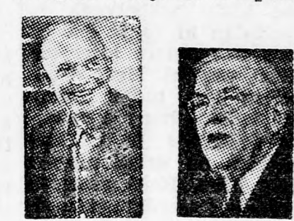
EISENHOWER J. F. DULLES

Az Egyesült Államokban a napokban egy könyv került piacra, amely valószínűleg sok vihart fog kiváltani az amerikai közvéleményben. A könyv az amerikai titkos szolgálat munkáit ismerteti, miközben sok, eddig titokban tartott dologról rántja le a leplet.