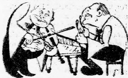
T. A., Kikár Dizengoff 14/16

Vacsorázzon Ön is a PAPRIKA étteremben (volt Vén diófa) cigányzene mellett