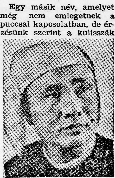
U NU volt miniszterelnök

A katonai puccs ezt problé-mát is megoldotta.