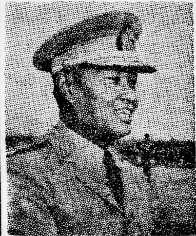
NE WIN tábornok, az új miniszterelnök

Semmi kétség afeől, hogy Ne Win és tisztjei, akik most átvették az ural-