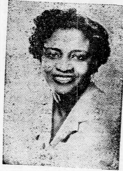
Tubman elnök hitvese

Holnap a magas vendég Tel Aviv város vendége lesz Dr. William Tubman és hitvese, Antoinette, tegnap látogatást tett a hadiipari gyárüzemekben, ahol nagy érdeklődést tanúsított a különböző gyártási folyamatok iránt. Kijelentette, hogy eddig csupán Izrael történelmi háttérét ismerte, ez a látogatás azonban lehetőséget nyújt számára, hogy megismerje Izrael magas technológiai felkészültségét.