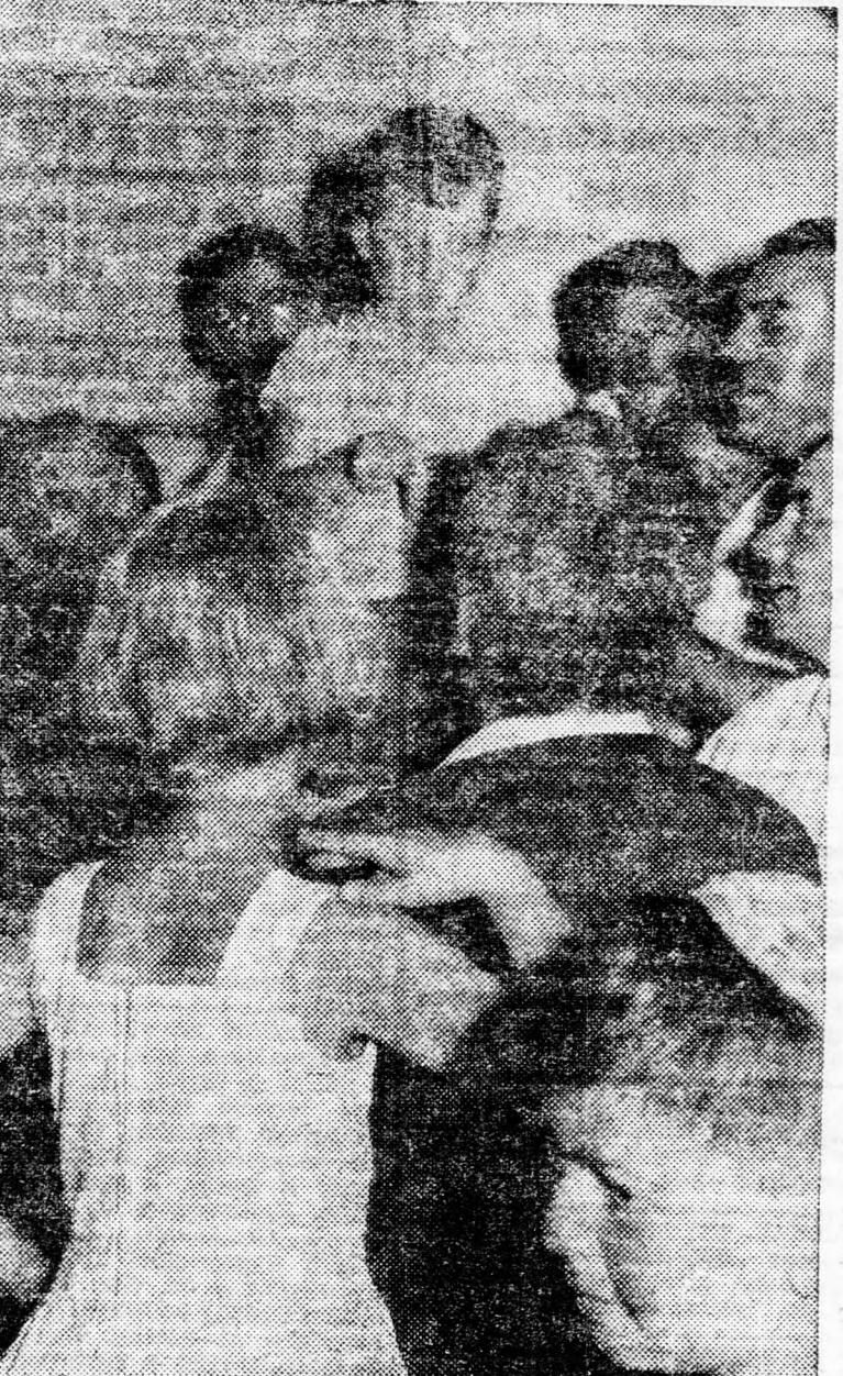
A legizgalmasabb perc: Kihúzzák a főnyereményt