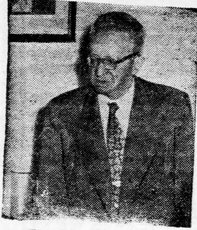
Jicchák Ezen Ovi

Az elnök látogatása azt a barátságot még csak jobban kimélyítette. Ezt bizonyítja a néptömegek spontán lelkesedése ezekben az