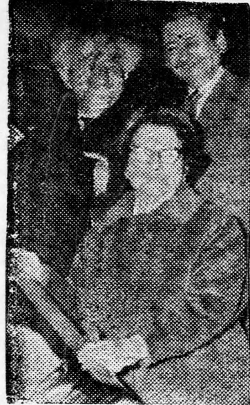
Paula és Dávid Ben Gurion

Paula Ben Gurionnak, a miniszterelnök feleségének hetvenedik születésnapja alkalmából napközi otthon létesítését határozták el tiszteivel. Az adományozók között, akik az intézmény felállításához hozzájárultak, a miniszterelnök felesége nagy meglepetéssel